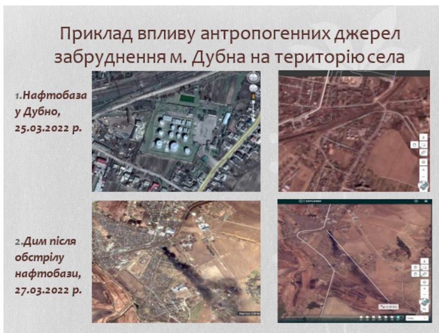
Рис. 1. Аналіз поширення диму від пожежі на нафтобазі у Дубно у напрямку території дослідження (за даними ДЗЗ)

Варто зазначити, що особливістю фізико-географічного розташування села є його розміщення у безпосередній близькості до східних околиць м. Дубно. Оскільки панівними вітрами в регіоні є західні та північно-західні вітри, то викиди в атмосферне повітря, які утворюються над містом, часто зносяться повітряними потоками у бік Рачина. Село знаходиться у «вітровій тіні» м. Дубно, що несприятливо впливає на його екологічний стан. Зокрема, саме в зоні, де місто і село змикаються, розміщені низка промислових підприємств: сушильний завод, цукровий завод