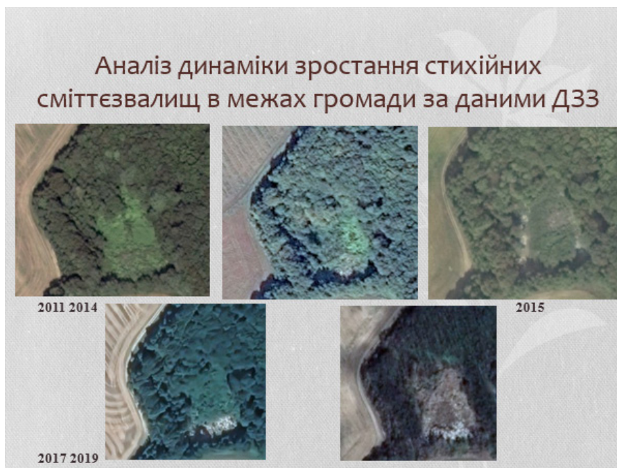
Рис. 2. Аналіз зростання площі одного зі стихійних сміттєзвалищ поблизу с. Рачин у лісовому масиві Мізоцького кряжу (за даними ДЗЗ)