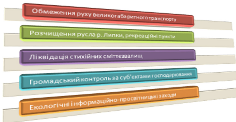
Рис. 6. Пріоритетні напрями вирішення екологічних проблем села

Рекомендовані заходи для покращення екологічного стану громади с. Рачин