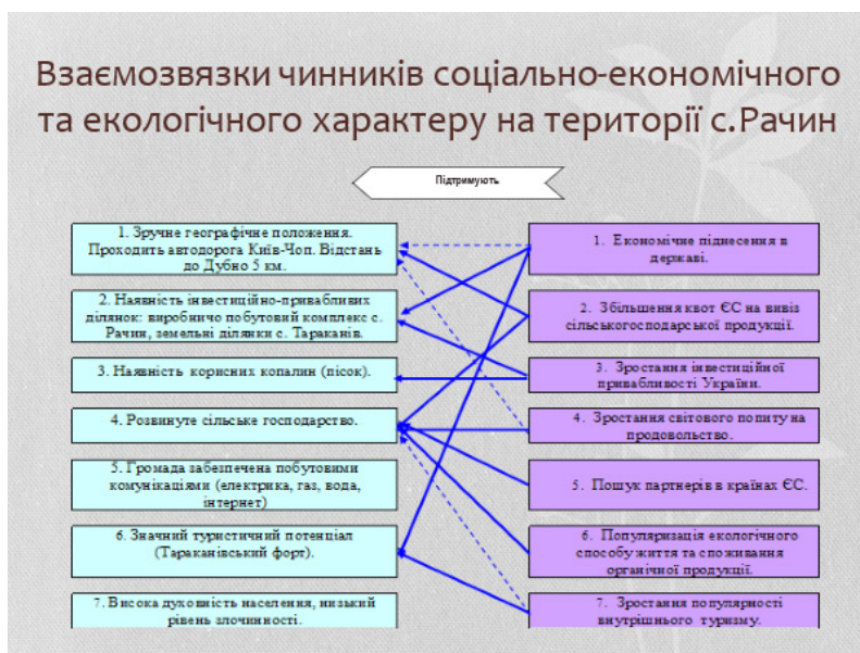
Рис. 4. Взаємозв'язки чинників соціально-економічного та екологічного характеру на території с. Рачин (за даними [8; 9; 12])