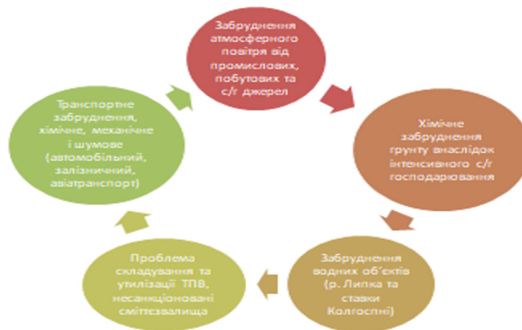
Рис. 5. Основні екологічні проблеми с. Рачин

Рекомендовані заходи для покращення екологічного стану громади с. Рачин