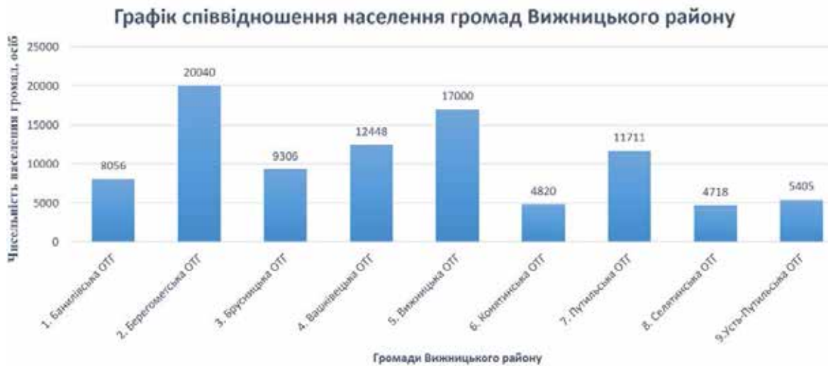
Рис. 1. Співвідношення населення громад Вижницького району