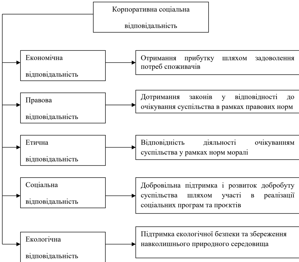
Рисунок 2 – Напрями корпоративної соціальної відповідальності