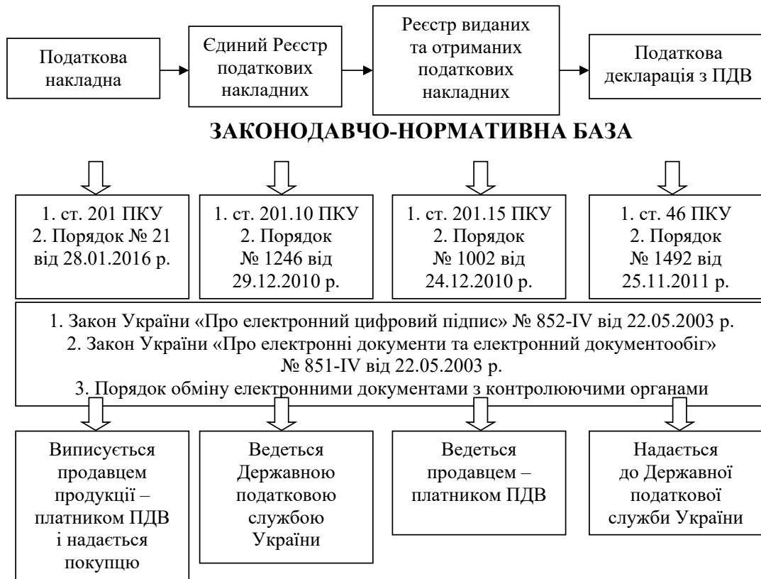
Рисунок 1 – Послідовність руху податкових документів при розрахунку ПДВ

ється наявністю низки особливостей. Податкові накладні складаються та реєструються в Єдиному реєстрі податкових накладних (ЄРПН). Складання податкової накладної – обов'язок платника податку. Податкова накладна складається в електронній формі на дату виникнення податкових зобов'язань.