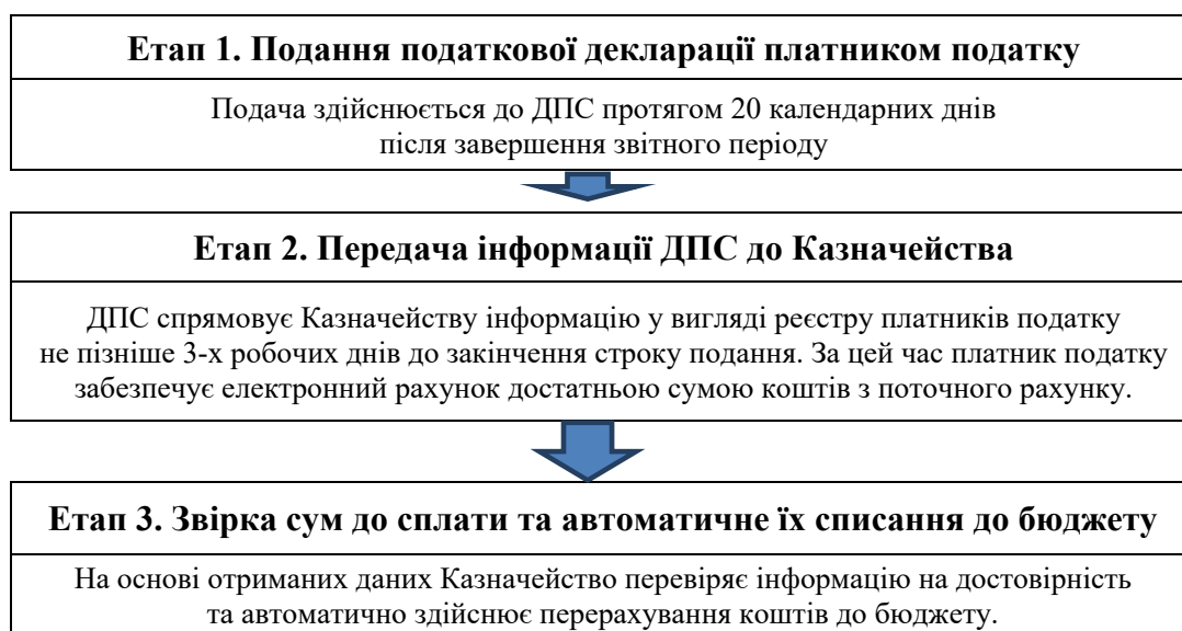
Рисунок 3 – Послідовність погашення податкового зобов'язання з ПДВ

Проте, запроваджені у 2022 році новації, принципово не вплинули на вирішення проблем в адмі-