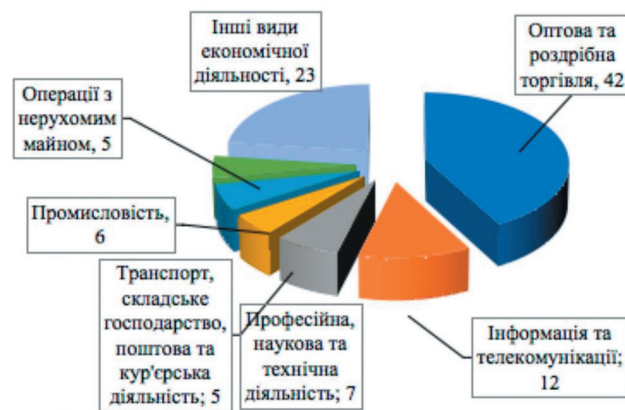
Рисунок 1 – Структура діючих бізнес-структур в Україні за видами економічної діяльності у 2022 році, у %

Як повідомлялось, за рік повномасштабного вторгнення Україна втратила понад 3 мільйони робочих місць. Для покращення ситуації в цьому напрямку уряд запровадив програму «Робота» [9]. Аналізуючи основні показники діяльності бізнес-структур в Україні протягом 2018–2022 рр., зауважуємо, що середні, малі та мікропідприємницькі бізнес-структури в Україні були найбільшими роботодавцями (табл. 2).