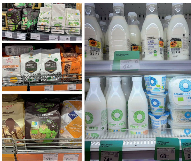
Зображення 1. Органічна продукція на полицях супермаркетів «Арсен» і «Сільпо» 30.12.2024 р.

Висновки. Згідно нашого опитування населення Львівщини, 34,5% респондентів дуже позитивно і 49,4% швидше позитивно ставляться до органічної продукції. Населення Львівщини готове купувати овочі / фрукти / ягоди (77%), молочні продукти (58,6%), яйця (35,6%), м'ясо / ковбаси (33,3%), мед (25,3%). Беручи до уваги, що в межах досліджуваної території активно розвивається органічне рослинництво, можемо стверджувати, що органічні оператори Львівщини окрім експорту, здатні задовольнити потреби населення на внутрішньому ринку. Для купівлі органічних продуктів 56,3% опитаних обирають мережеві магазини / супермаркети / гіпермаркети. При цьому зазначають, що потребують інформації на упакованні (67,8%), Негативний вплив на здійснення покупки має занадто висока ціна (35,6%) і не завжди в наявності потрібний асортимент (36,6%).