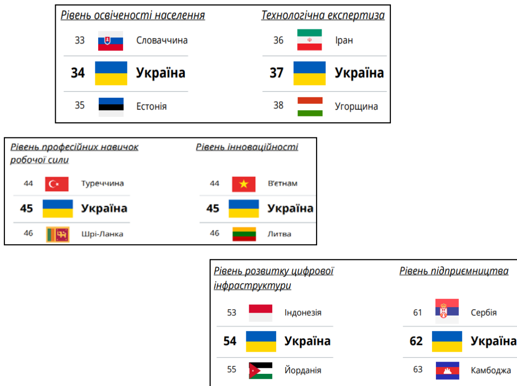
Рисунок 3 – Рівні визнання України щодо технологічного розвитку, 2023 р.

За результатами дослідження StartupBlink [10] світове населення посередньо сприймає Україну з огляду на рівень її технологічного розвитку. Найбільше визнання українці отримують за рівень освіченості та професійних навичок. На думку іноземців, у 2023 році Україна посідає такі наступні місця серед 87 країн світу (рис. 3).